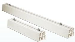
Бели PVC подови стойки (x2)