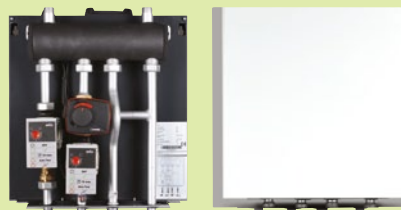
комплект за 2-ри отоплителен кръг за единична термopомпа