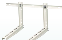
Стойки за стена * 600 мм (с гредя)