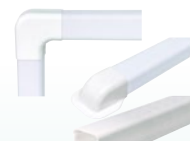
Изолация за хладилни тръби